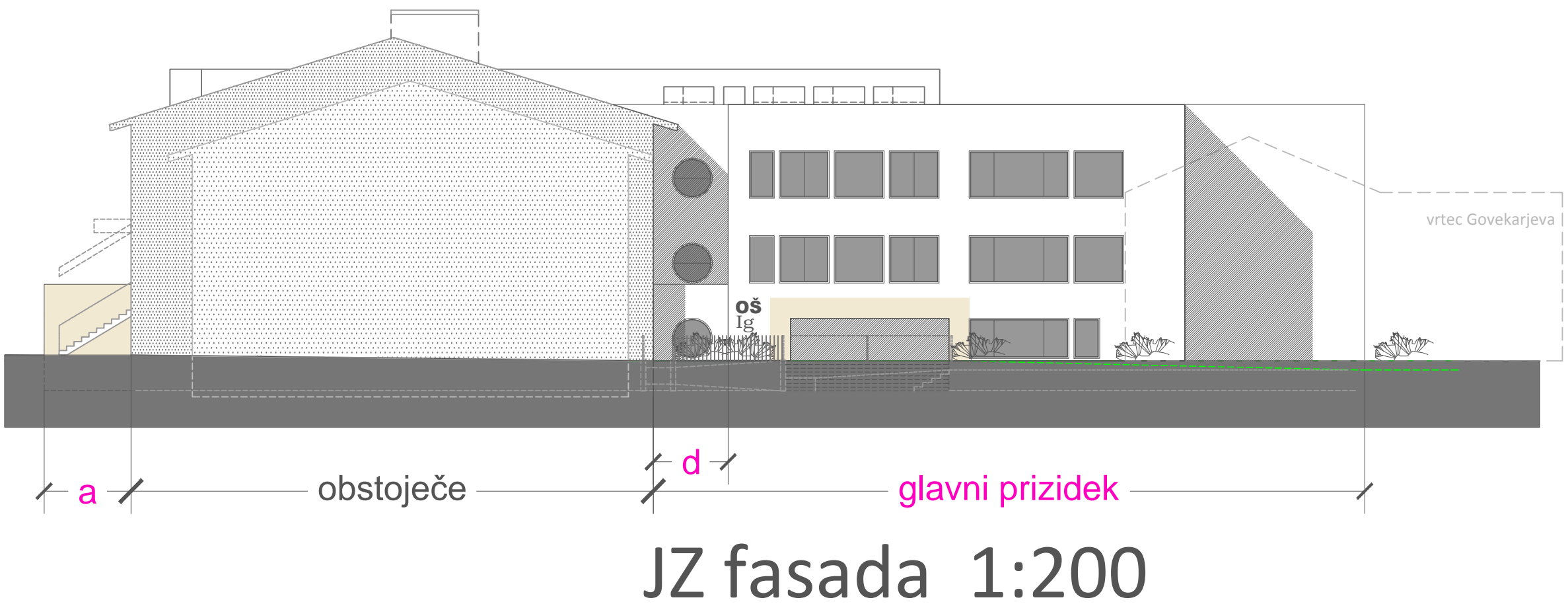
JZ fasada 1:200